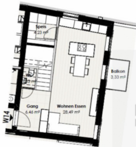
Wohnung 14 - 1. Obergeschoss