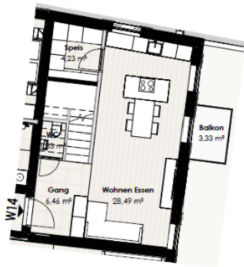
Wohnung 14 - 2. Obergeschoss