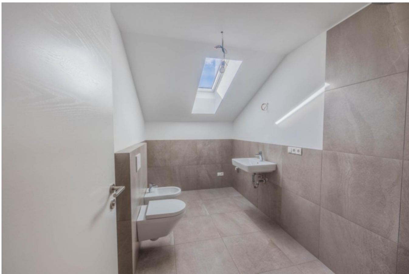
Wohnung 14 - 1. Obergeschoss