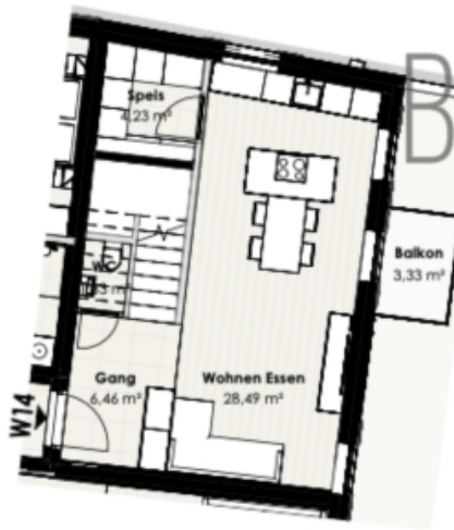
Wohnung 14 - 1. Obergeschoss