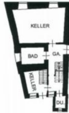
ERDGESCHOSS H = 2.26m