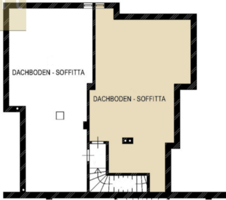
2. Stock - secondo piano