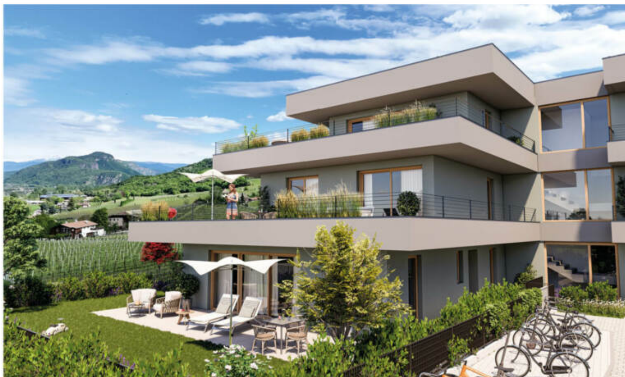
Wohnanlage Viride - Neumarkt/Egna complesso residenziale