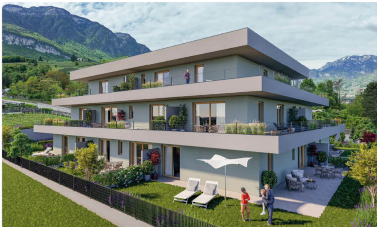
Wohnanlage Viride - Neumarkt/Egna complesso residenziale