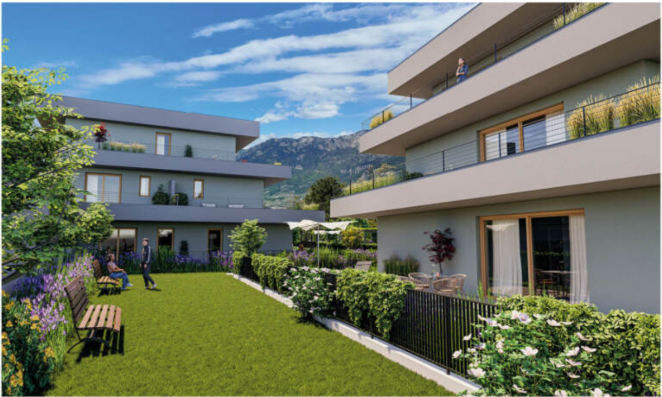
Wohnanlage Viride - Neumarkt/Egna complesso residenziale