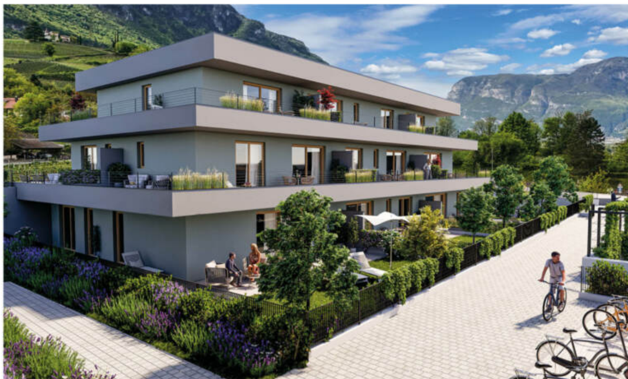
Wohnanlage Viride - Neumarkt/Egna complesso residenziale