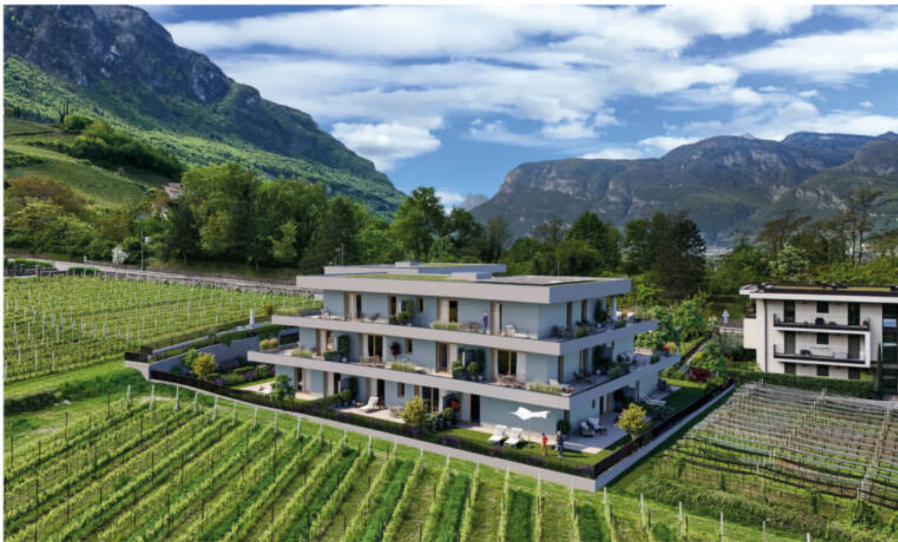
Wohnanlage Viride - Neumarkt/Egna complesso residenziale