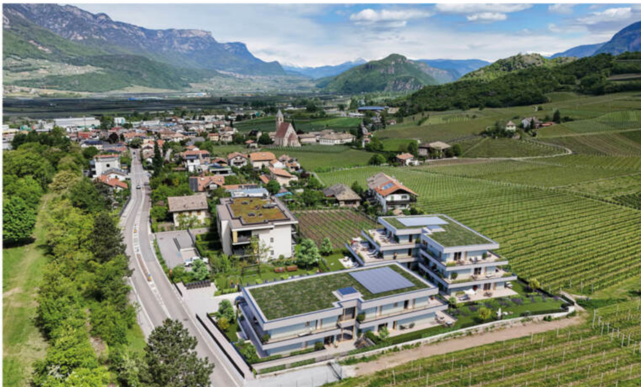
Wohnanlage Viride - Neumarkt/Egna complesso residenziale