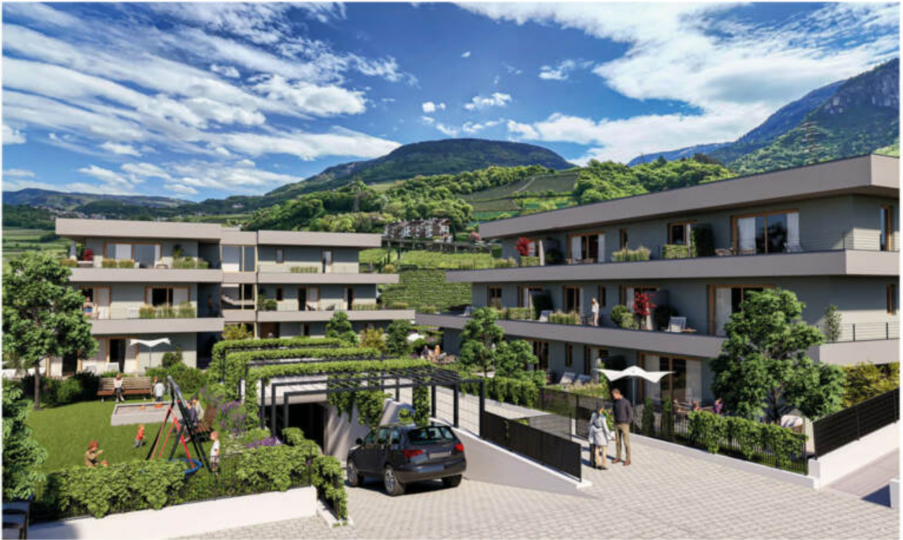
Wohnanlage Viride - Neumarkt/Egna complesso residenziale