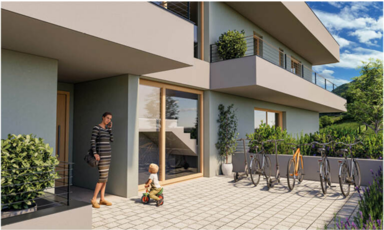
Wohnanlage Viride - Neumarkt/Egna complesso residenziale