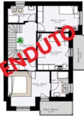
Este Obergeschoss - Piano Primo