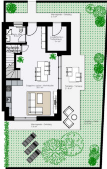
Erdgeschoss - Piano Terra