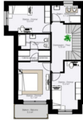
Este Obergeschoss - Piano Primo