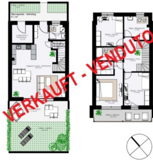
Erdgeschoss - Piano Terra