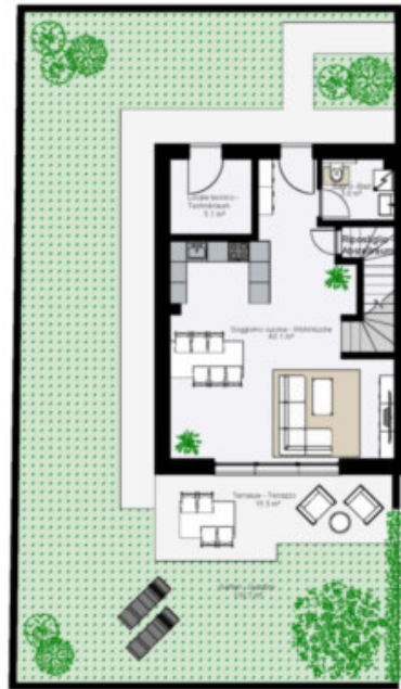
Erdgeschoss - Piano Terra