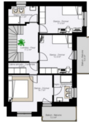
Este Obergeschoss - Piano Primo