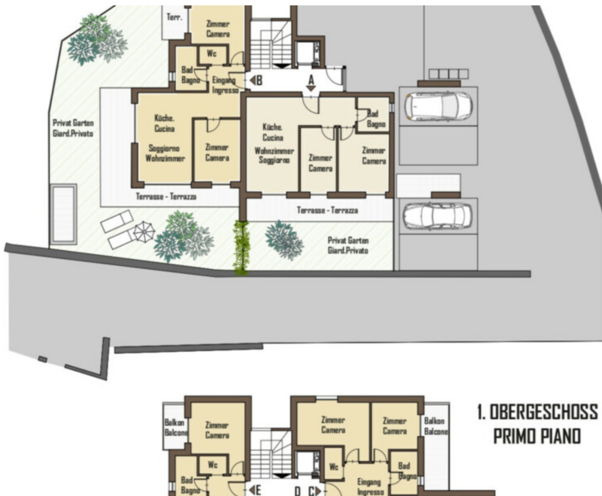
1. OBERGESCHOSS PRIMO PIANO