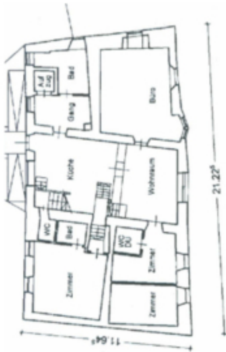
3. Stock H. 1,50 - 2,40