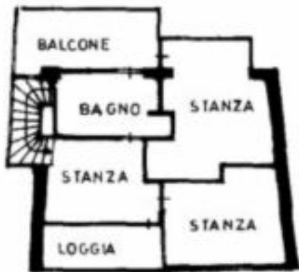
TERZO PIANO H = 150+2.40