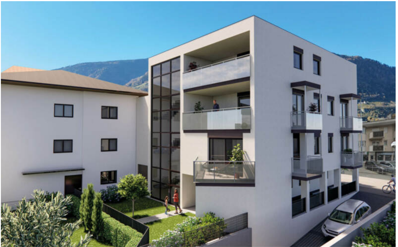
Wohnanlage Maria-Cristina complesso residenziale