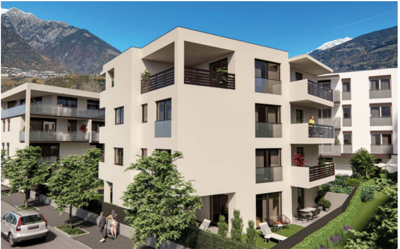
Wohnanlage Maria-Cristina complesso residenziale