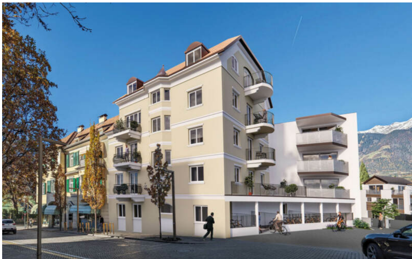
Wohnanlage Maria-Cristina complesso residenziale