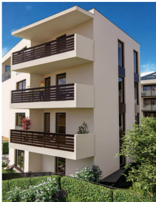
Haus B - Ansicht Süd-Ost Casa B - prospetto sud-est