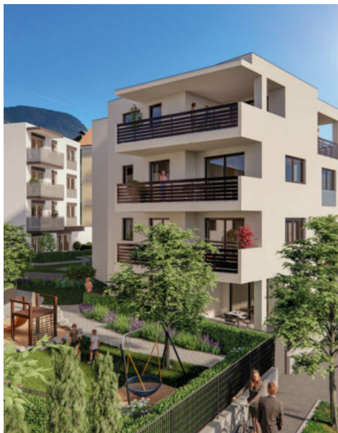
Wohnanlage Maria-Cristina complesso residenziale