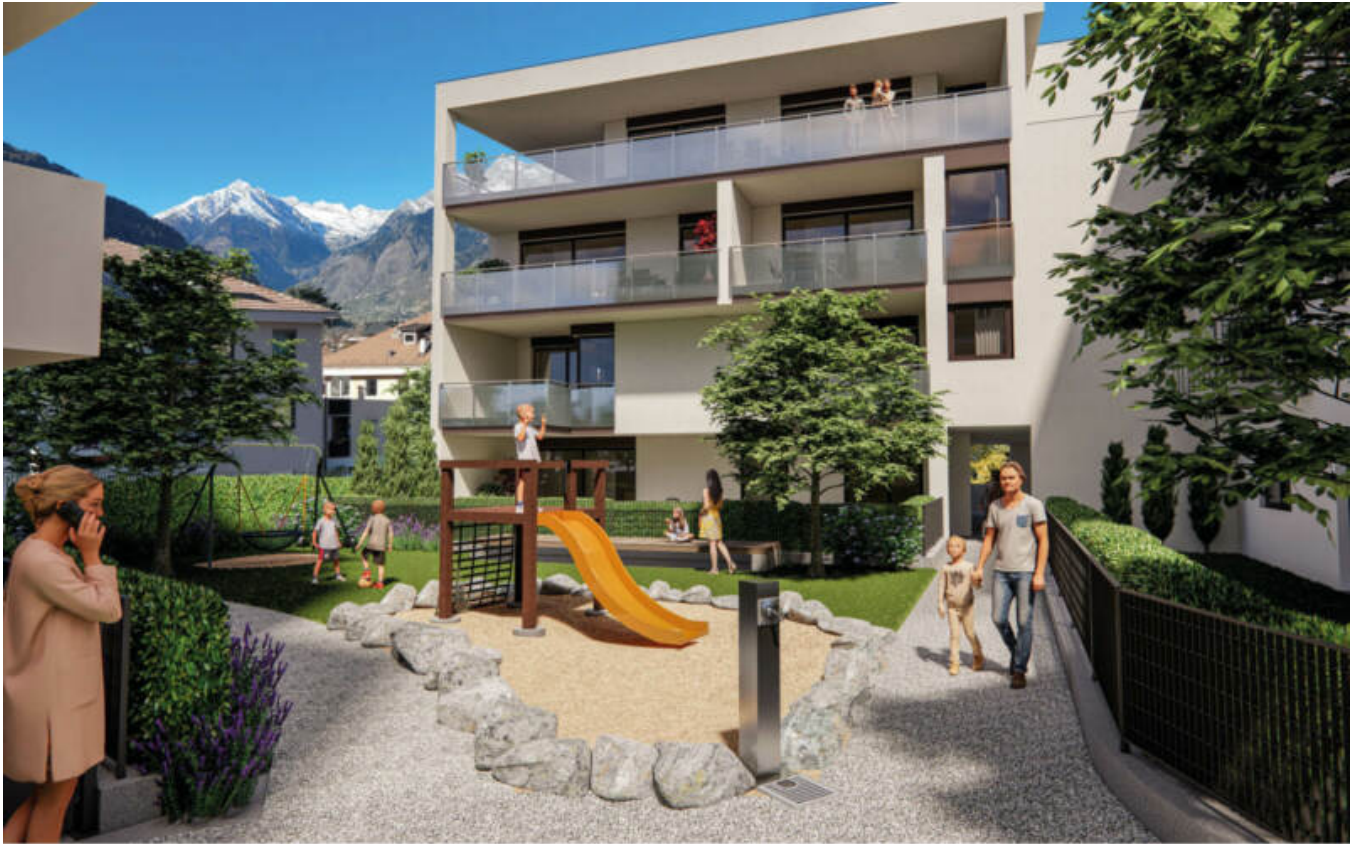
Wohnanlage Maria-Cristina complesso residenziale