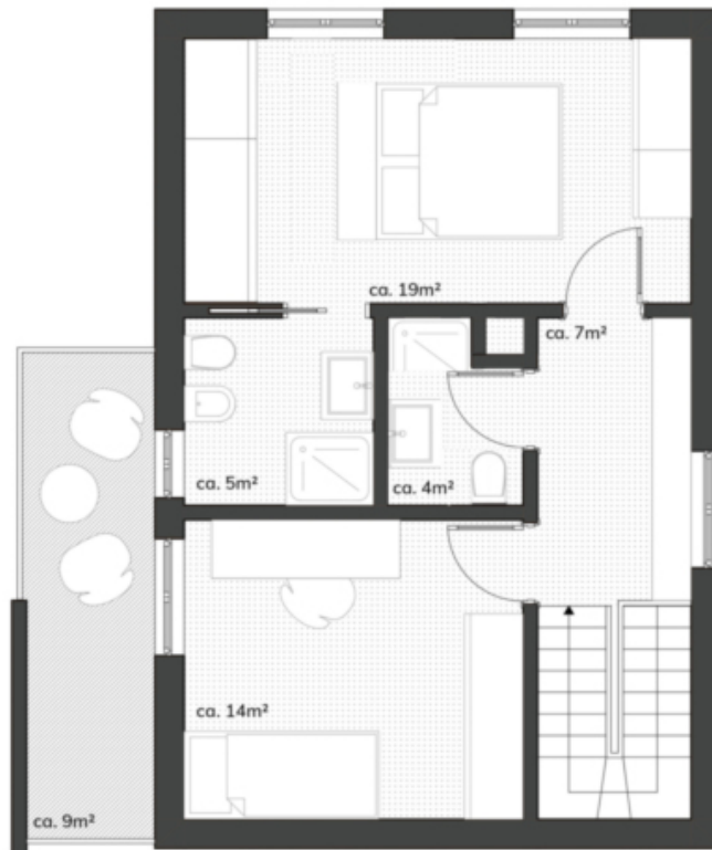
1. Obergeschoss | 1° Piano