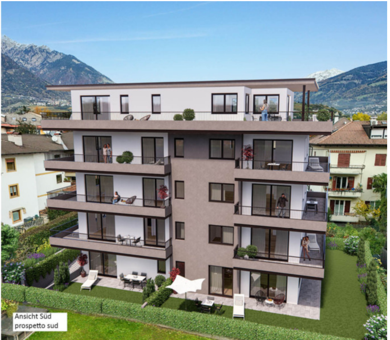
Ansicht Süd prospetto sud