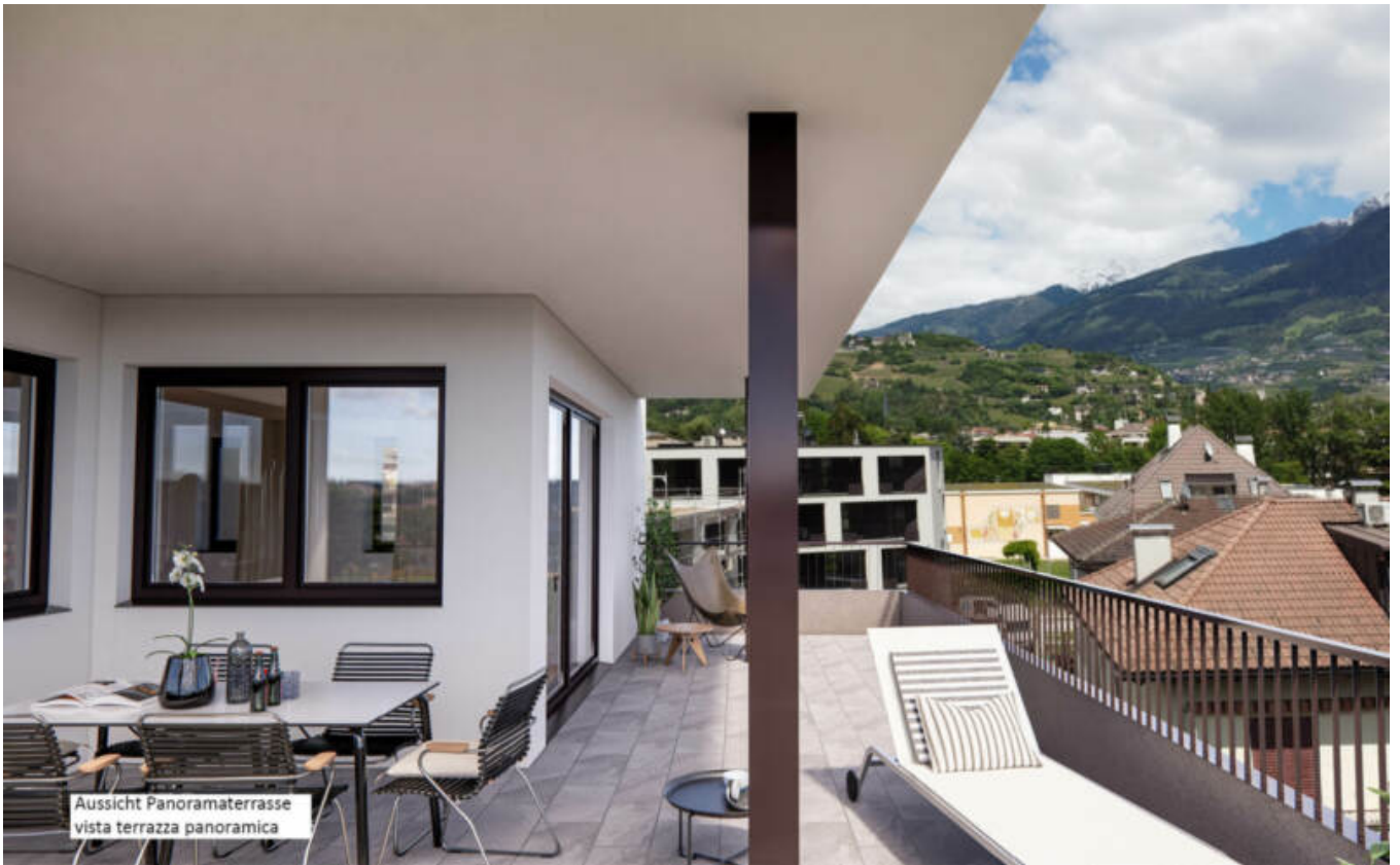
Aussicht Panoramaterrasse vista terrazza panoramica