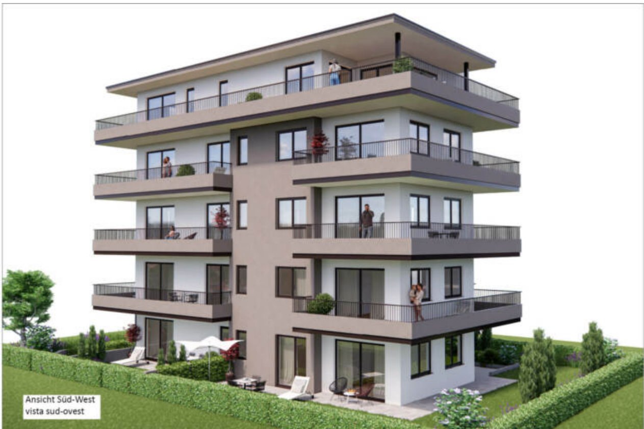
Ansicht Süd-West vista sud-ovest