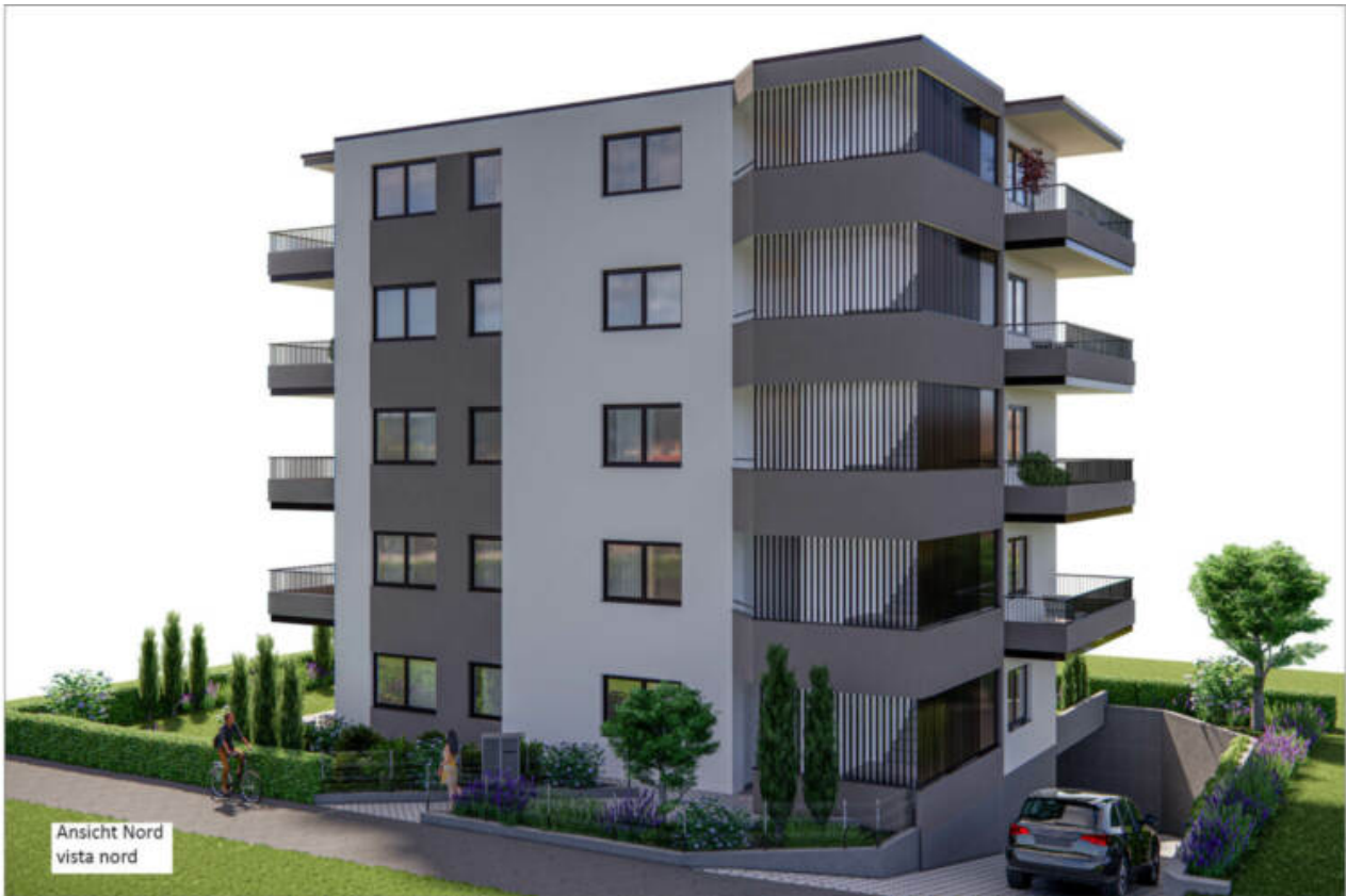
Ansicht Nord vista nord