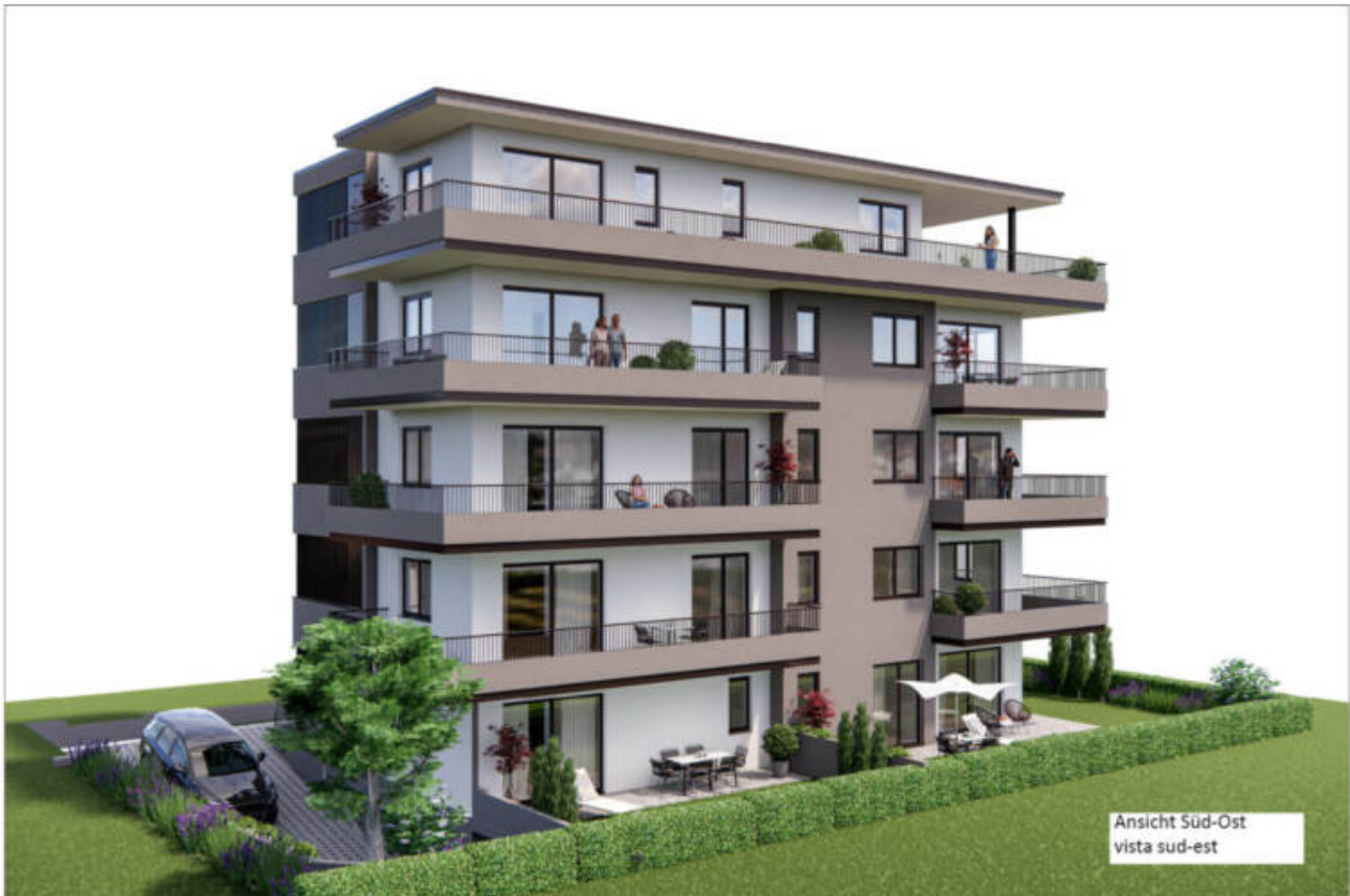
Ansicht Süd-Ost vista sud-est