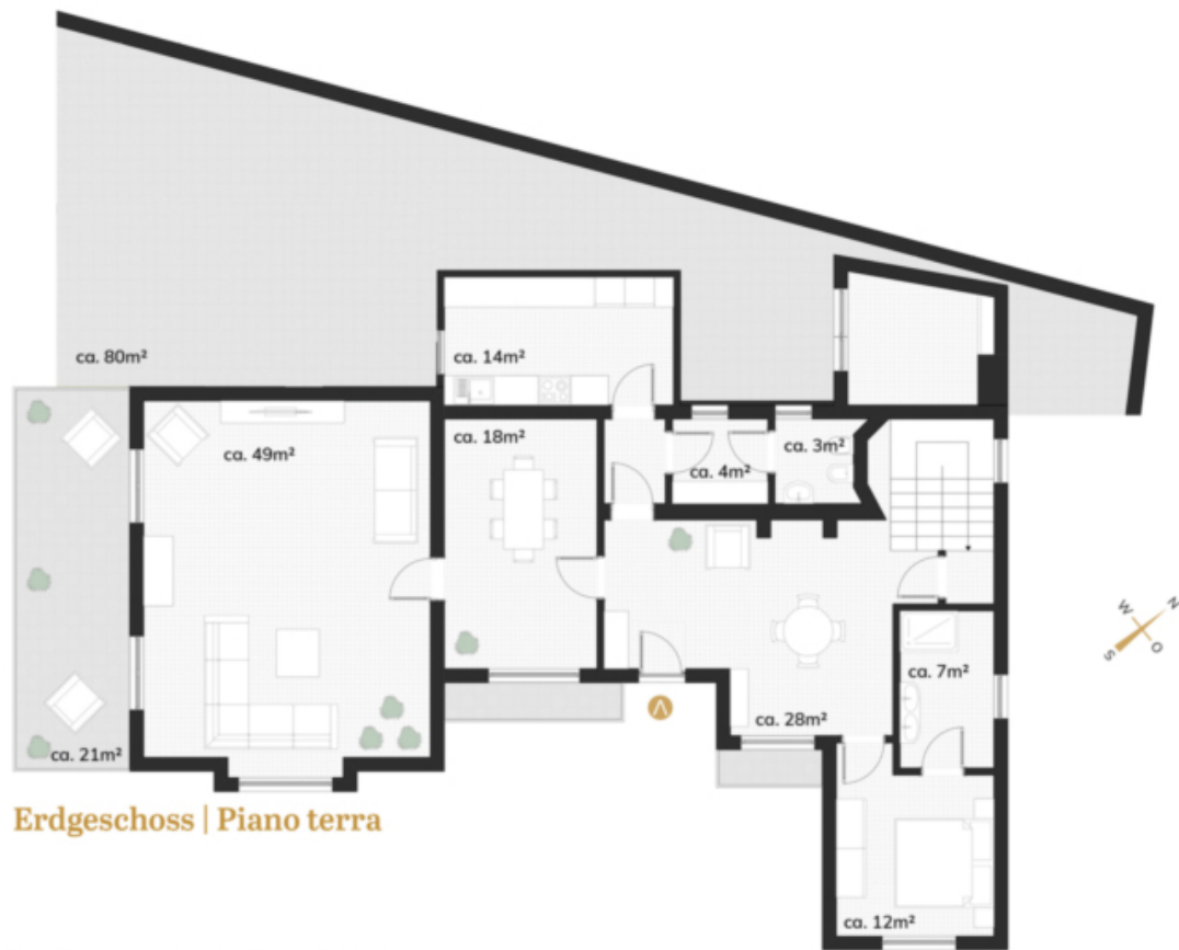
Erdgeschoss | Piano terra

Pläne folgen keinen Maßstab sofern nicht explizit angegeben. Alle Angaben ohne Gewähr. Änderungen vorbehalten. I piani non seguono scale se non specificatamente indicato. Tutte le dichiarazioni senza garanzia. Soggetto a modifiche.