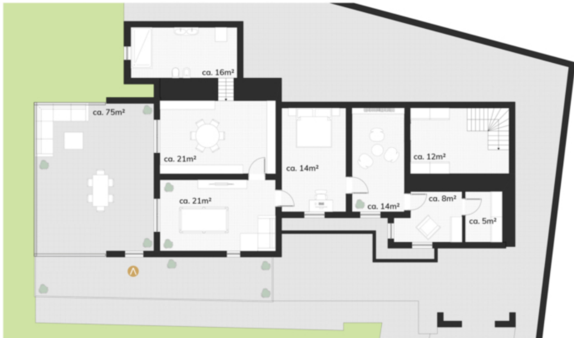
Tiefparterre | Piano seminterrato