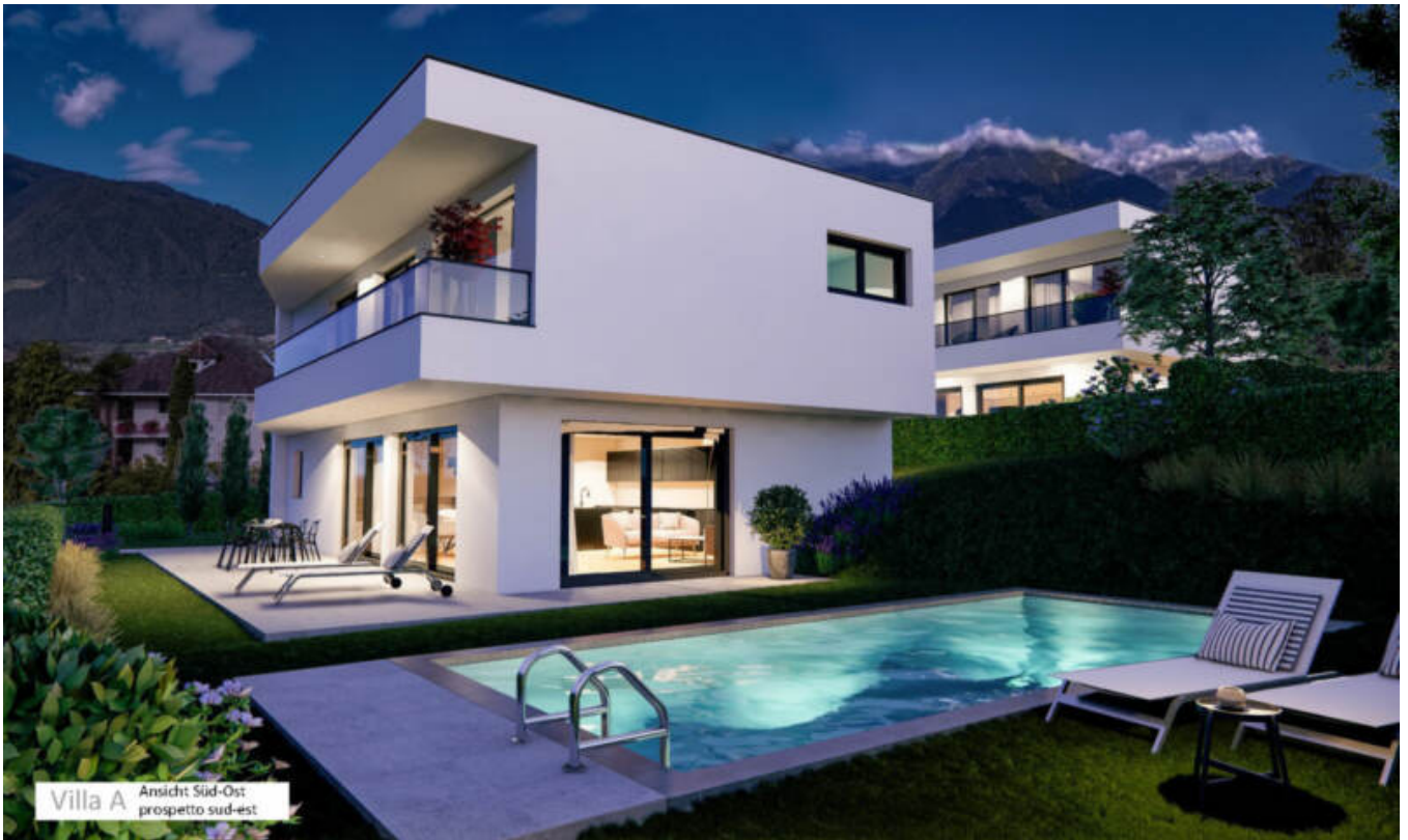
Villa A Ansicht Süd-Ost prospetto sud-est