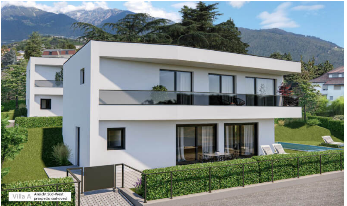
Villa A Ansicht Süd-West prospetto sud-ovest