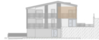
Ansicht Norden - Prospetto nord