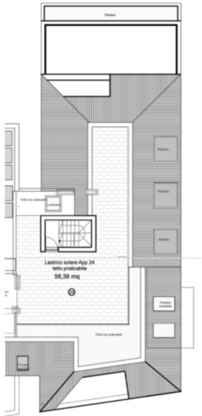
5. PIANO COPERTURA (2) 1:200