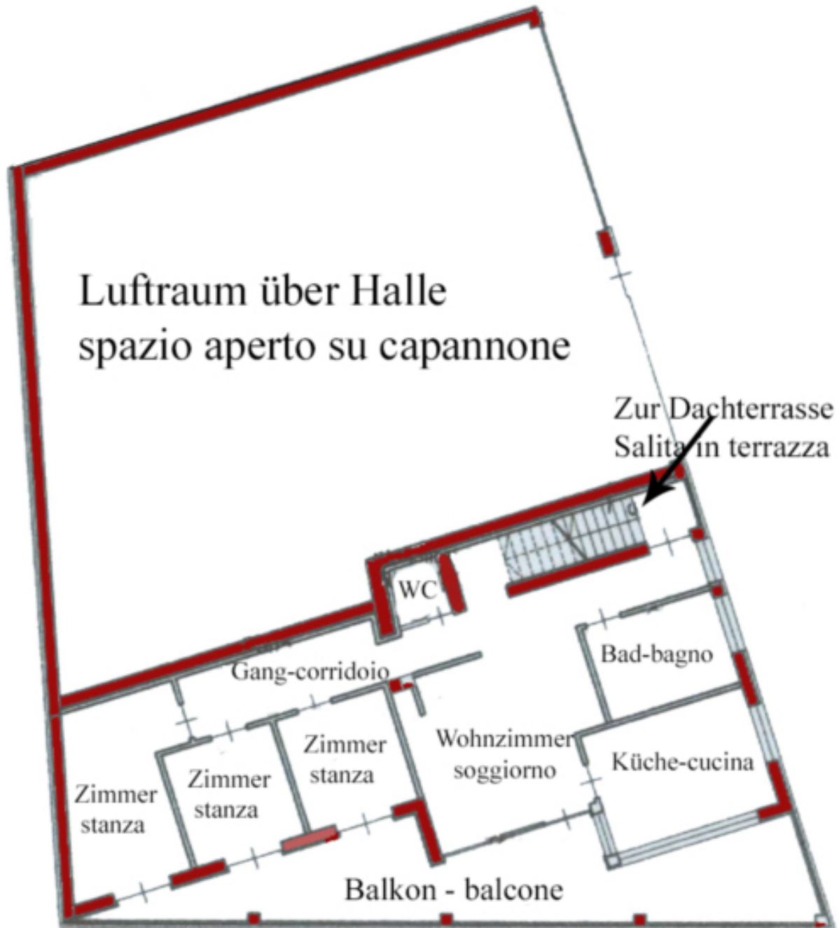
1. Stock - piano primo 104 m 2