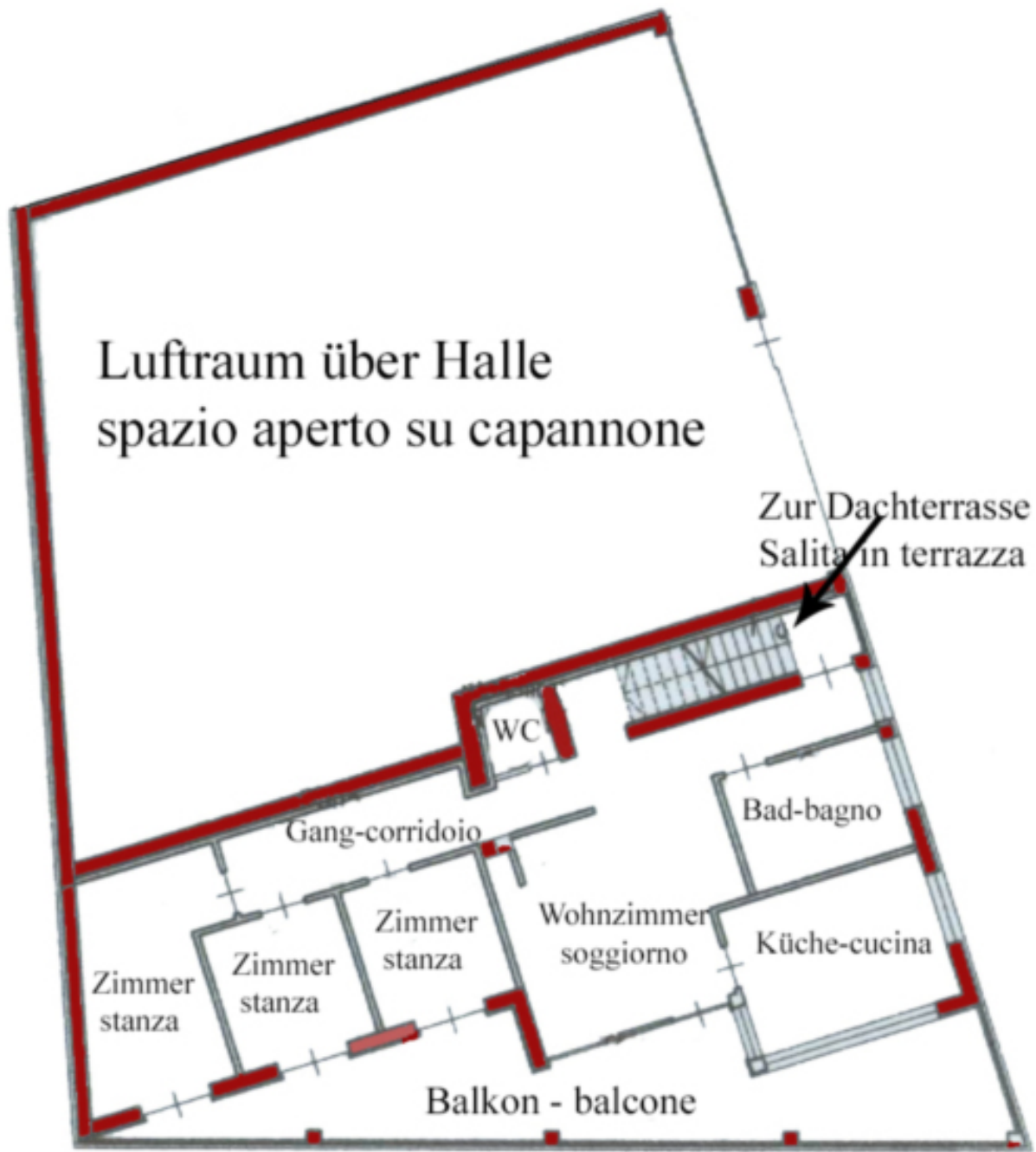
1. Stock - piano primo 104 m 2