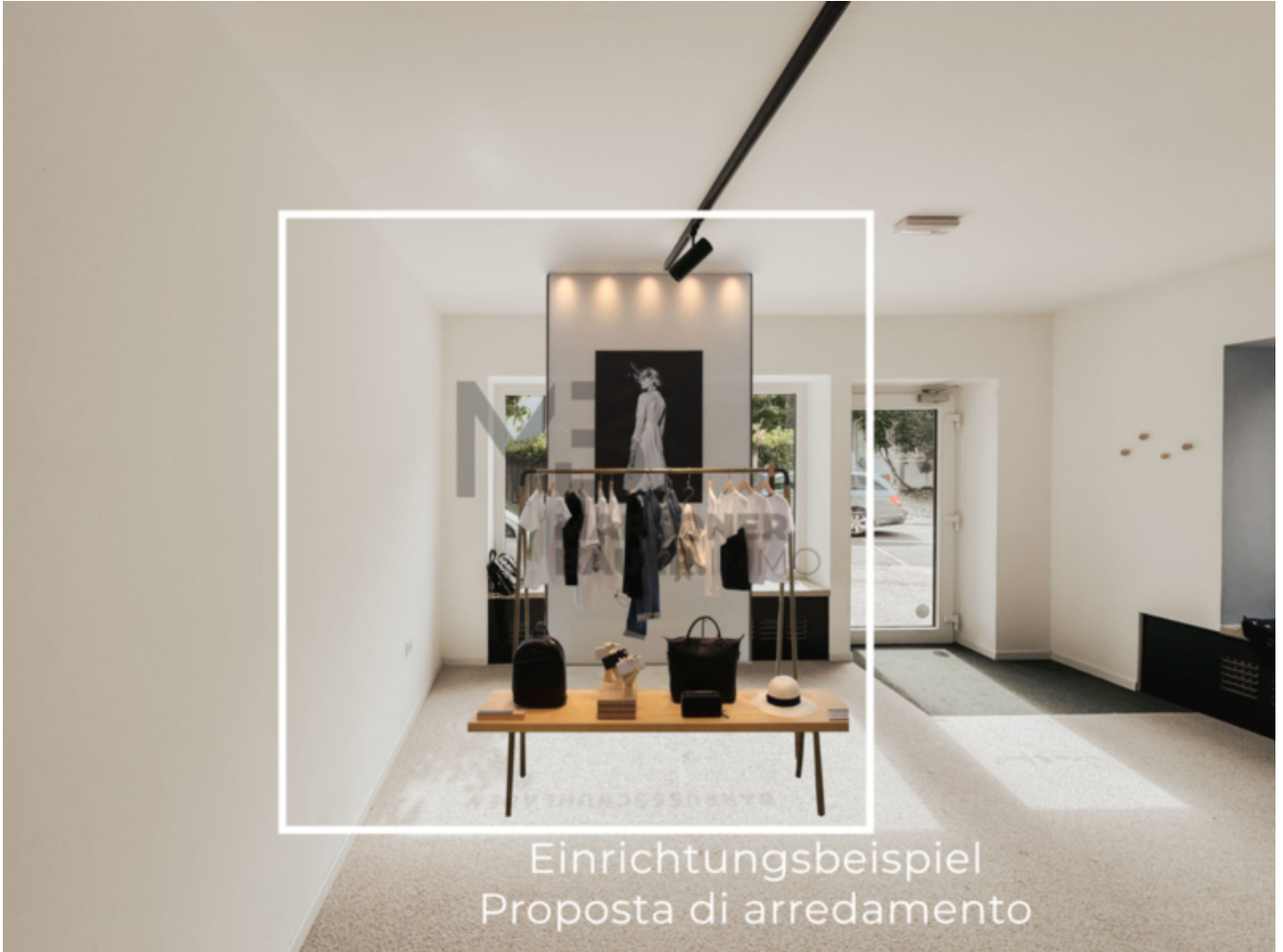
Einrichtungsbeispiel Proposta di arredamento