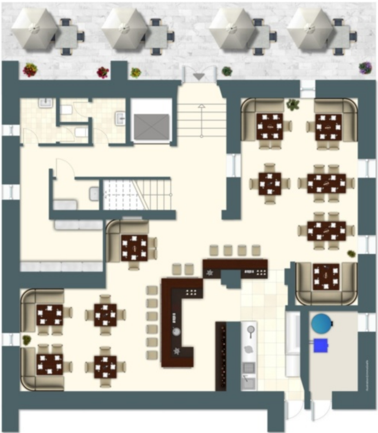
Exposplan, nicht maßstäblich