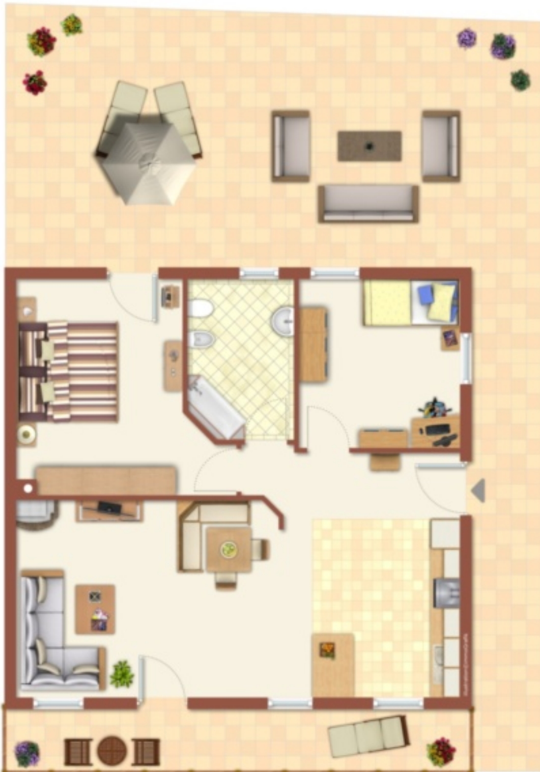
Exposiplan, nicht maßstäblich