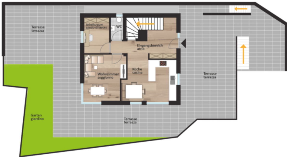
Erdgeschoss piano terra