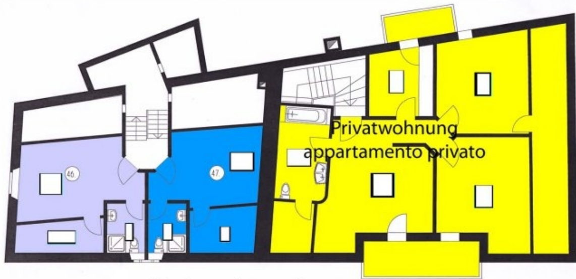
Dachgeschoss - piano sottotetto