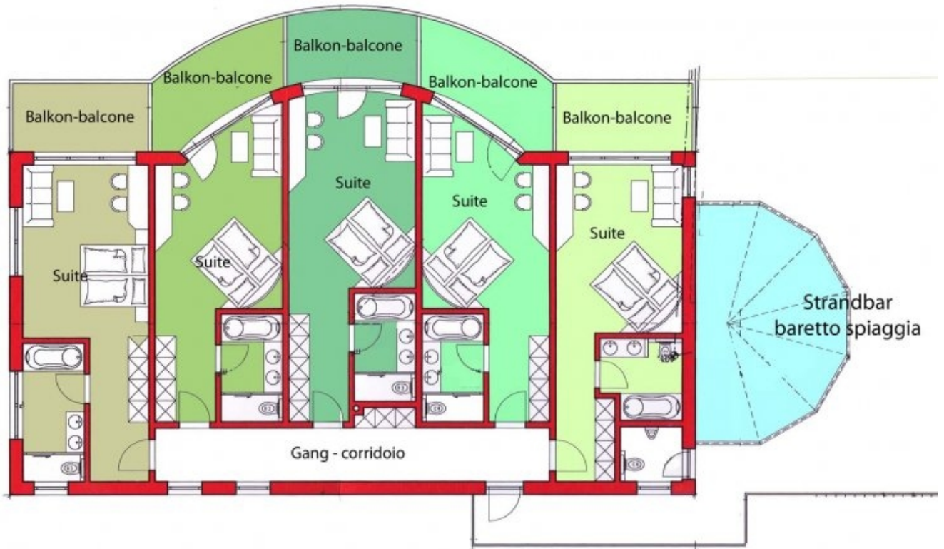
Neubau - costruzione nuova