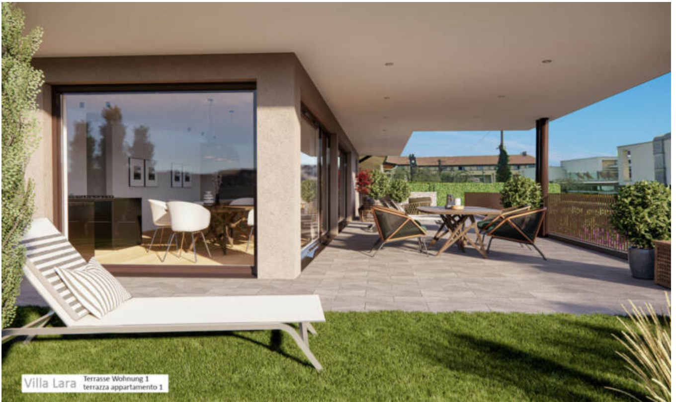
Villa Lara Terrasse Wohnung 1 terrazza appartamento 1