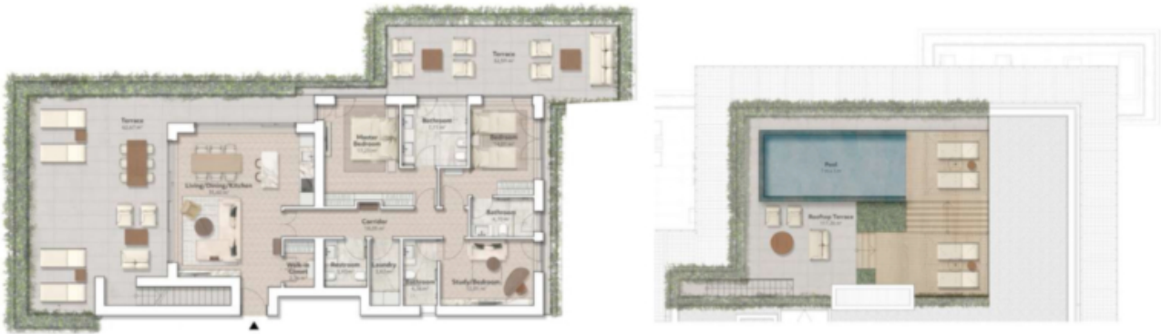
L3 - Olmo 115,36 m 2 zona giorno 103,89 m 2 terrazza 117,26 m 2 terrazza sul tetto