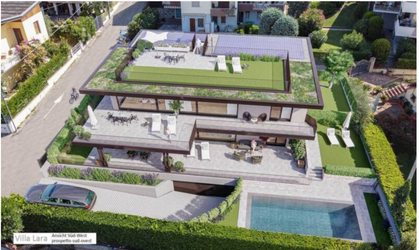
Villa Lara Ansicht Süd-West prospetto sud-ovest