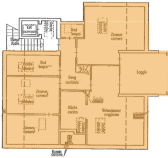
3. STOCK - 3. PIANO