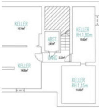
UNTERGESCHOSS H. 2,15m