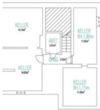
UNTERGESCHOSS H. 2,15m