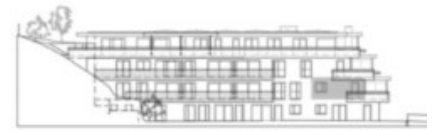
ANSICHT 020 PROSPETTO 000

FLÄCHE - SUPERFICIE: NETTO 82,87 m 2 BRUTTO 103,54 m 2 TERRASSE 47,29 m 2 TERRAZZA