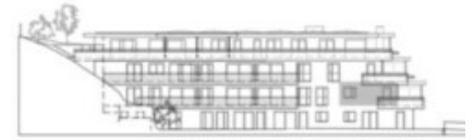
ANSICHT 020 PROSPETTO 000

FLÄCHE - SUPERFICIE: NETTO 82,87 m 2 BRUTTO 103,54 m 2 TERRASSE 47,29 m 2 TERRAZZA