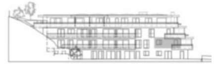
ANSICHT 020 PROSPETTO SUD

FLÄCHE - SUPERFICIE: NETTO 82,87 m 2 BRUTTO 103,54 m 2 TERRASSE 47,29 m 2 TERRAZZA