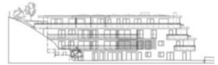
ANSICHT SÜD PROJEKT 1/2 SÜD