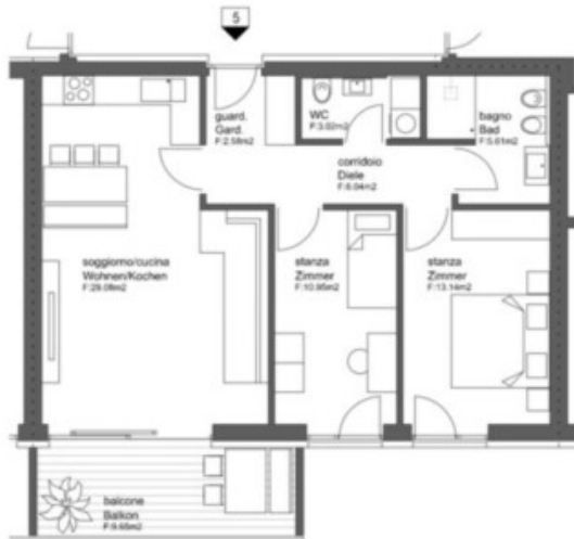
WOHNUNG 5 - APPARTAMENTO 5

FLÄCHE - SUPERFICIE: NETTO 70,42 m 2 BRUTTO 85,27 m 2 BALKON 9,65 m 2 BALCONE