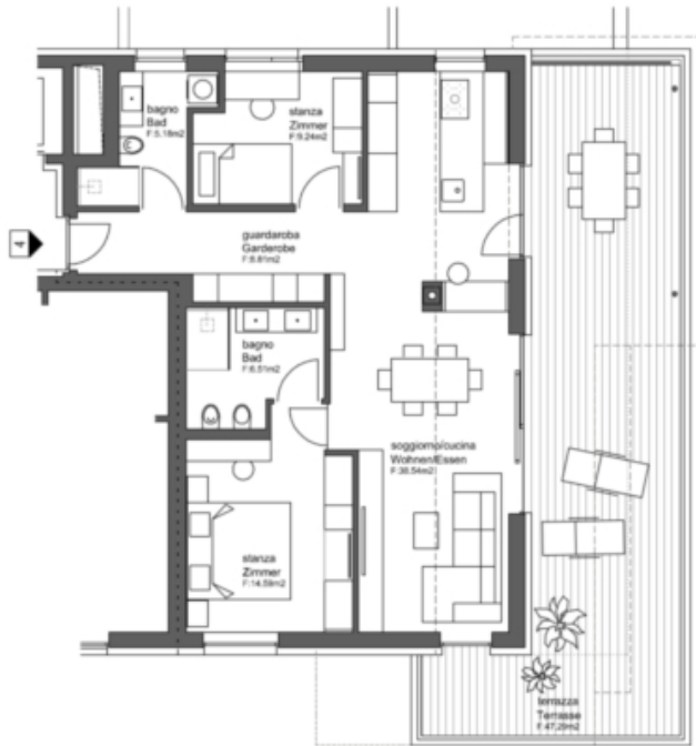
WOHNUNG 4 - APPARTAMENTO 4

FLÄCHE - SUPERFICIE: NETTO 82,87 m 2 BRUTTO 103,54 m 2 TERRASSE 47,29 m 2 TERRAZZA