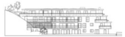
VISUALITÀ SUD PROSPETTIVO SUD