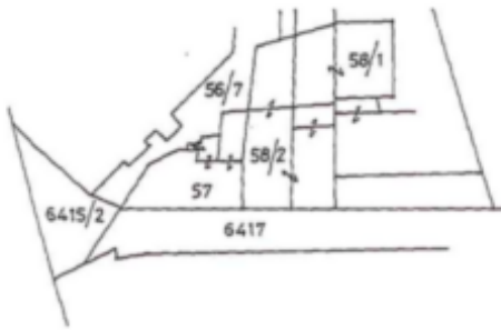
MAPPENAUSZUG Masstab 1:1000