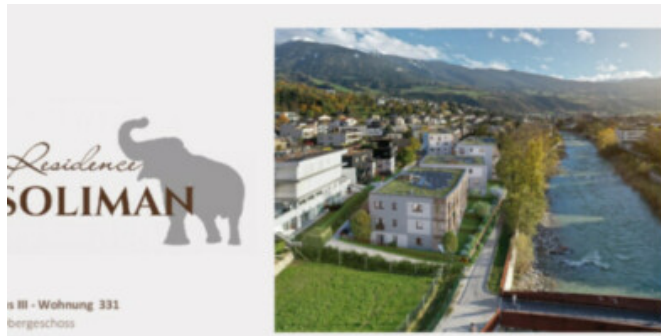
Haus III - Wohnung 331 bergeschoss