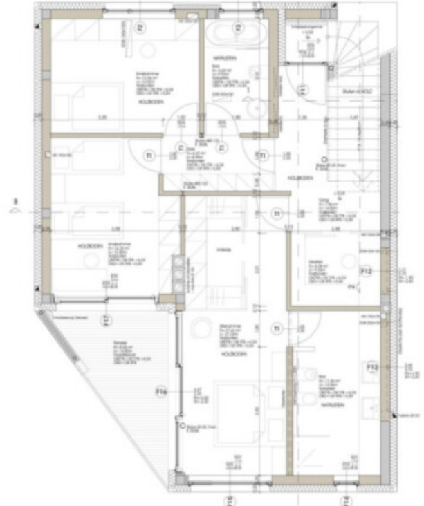
DACHGESCHOSS M 1:50