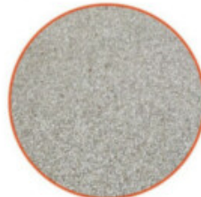
AUSSENBODENBELÄGE: FUSSGÄNGERRAMPE, FAHRRADABSTELLPLÄTZE, GEMEINSCHAFTSHOF, EINGANGSBEREICH UND ERDGESCHOSS TERRASSEN / PAVIMENTAZIONE ESTERNA: RAMPA PEDONALE, PARCHEGGIO PER BICICLETTE, CORTILE COMUNE, AREA D'INGRESSO E TERRAZZE AL PIANO TERRA

Material: Steinteppich / Materiale: tappeto di pietra Farbe: Grau / Color: grigio