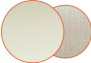
FASSADENPUTZ / INTONACO DELLA FACCIATA

Farbe: Granital weiß / Color: bianco granitico Granulometrie: Grobputz / Granulometrie: intonaco ruvido graffiato