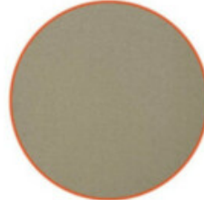
METALLRAHMEN DER FENSTER, METALLGELÄNDERN DER TERRASSEN, DACH UND ABDECKBLECHE / TELAJ ESTERNI DELLE FINESTRE, PARAPETTI DELLE TERRAZZE, TETTO E COPERTURA INGRESSO

Material: Metall / Materiale: metallo Farbe: Bronze / Color: bronzo