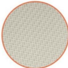
SENKRECHT-MARKISEN / TENDE DA SOLE VERTICALI

Material: Textur / Materiale: tessuto Farbe: Hellbeige / Color: beige chiaro