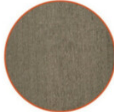
HOLZLAMELLEN FÜR DIE FASSADE, FENSTERRAHMEN UND ZWISCHENDECKE DER TERRASSEN / LAMELLE IN LEGNO PER LE FACCIATE, CORNICI DELLE FINESTRE E CONTROSOFFITTO DELLE TERRAZZE

Material: Holz / Materiale: legno Farbe: Quarzgrau / Color: grigio quarzo