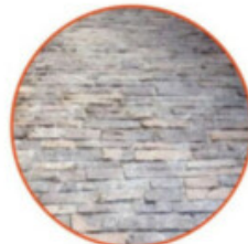
AUSSENBODENBELÄGE: GARAGENRAMPE UND ZUFAHRTSSTRASSE / PAVIMENTAZIONE ESTERNA: RAMPA DEL GARAGE E STRADA DI ACCESSO

Material: Porphy / Materiale: porfido Farbe: Grau / Color: grigio