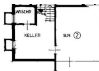
1 o UNTERGESCHOSS H. 2.60 m