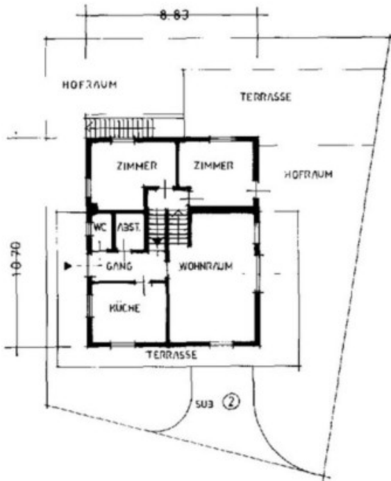
ERDGESCHOSS H. 2.60m