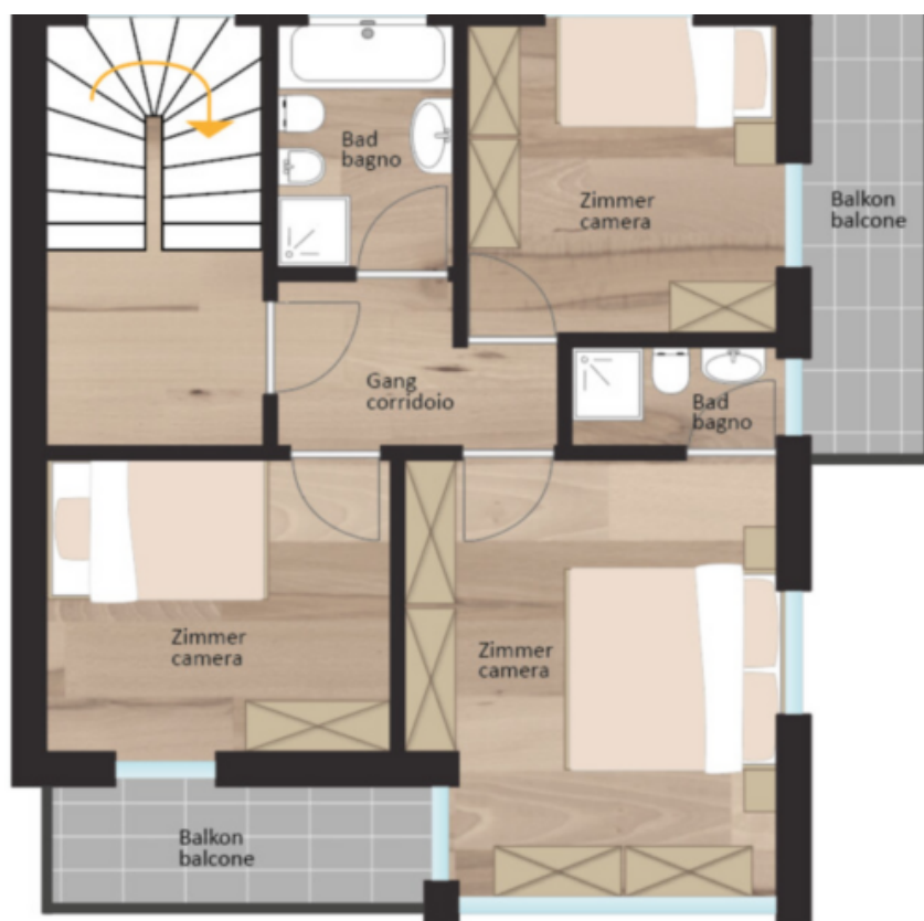
1. Obergeschoss primo piano