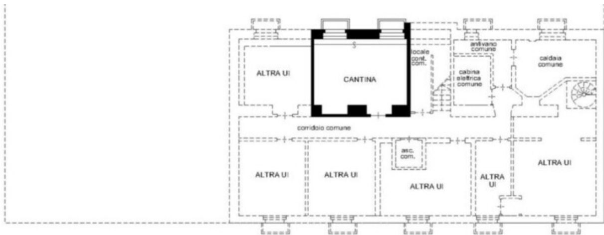
PIANO TERRA H= ml. 3.35