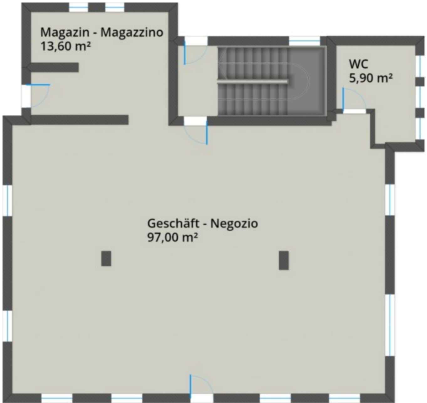
Erdgeschoss - Piano terra