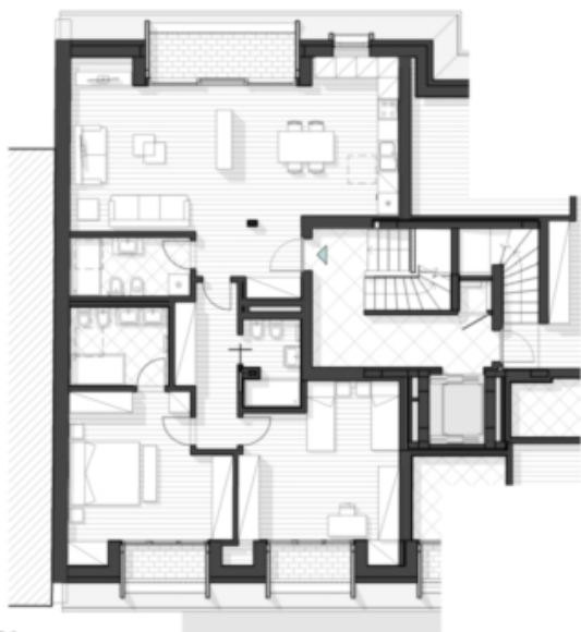
6.01 Unità al 6° piano Einheit im 6. Obergeschoss