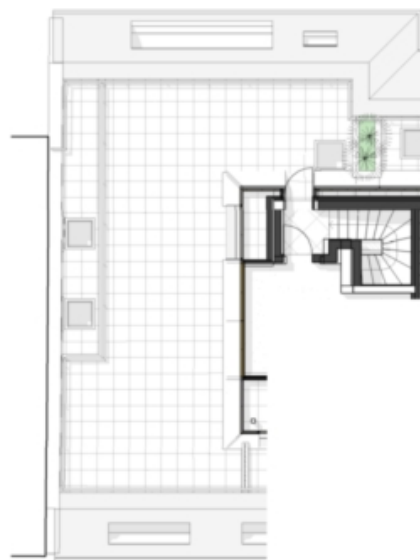
7.01 Terrazza al 7° piano Terrasse im 7. Obergeschoss