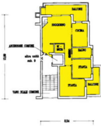
Piano Terzo h= 2.60 m.