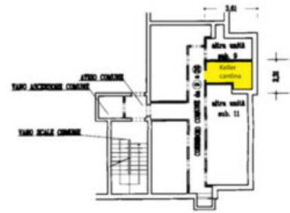
Piano Interrato h= 2.80 m.