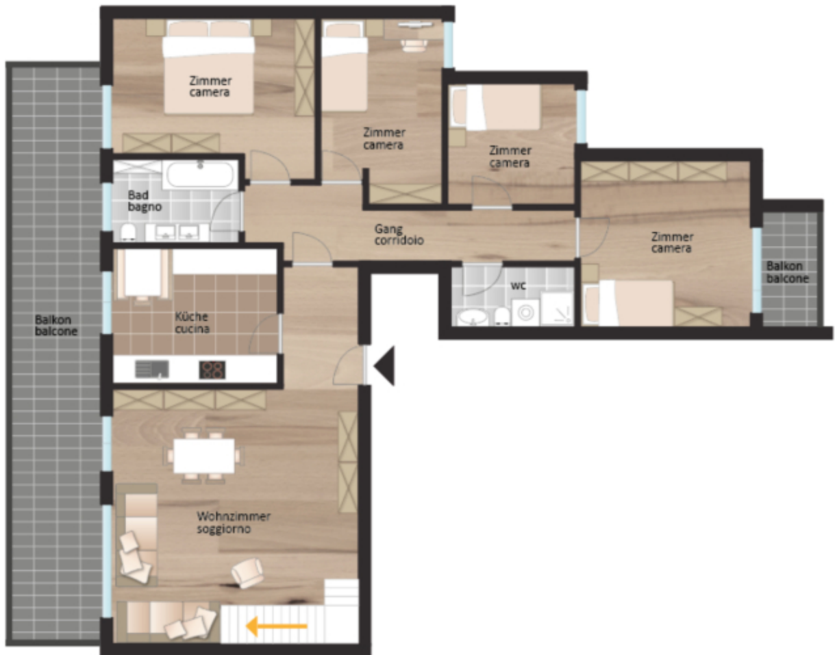
4.Stock Quarto piano