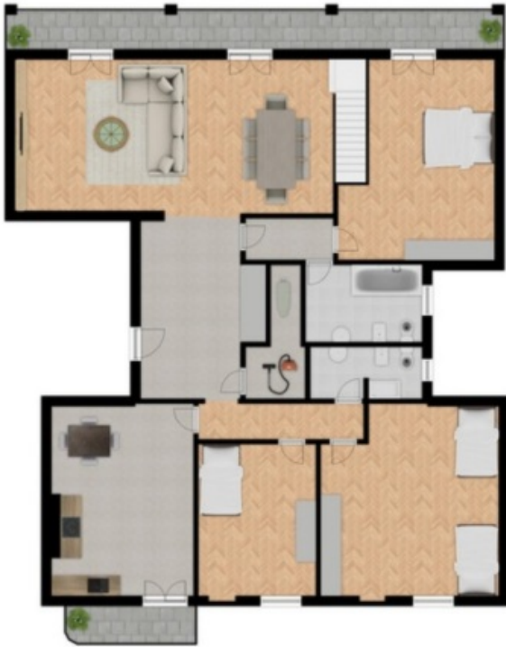
7. Stock - 7° piano