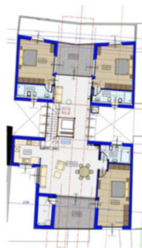
1:200 FÜNFTER STOCK / PIANO QUINTO