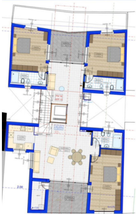
1:100 WOHNUNG 15 / APPARTAMENTO 15 - PM 16 1