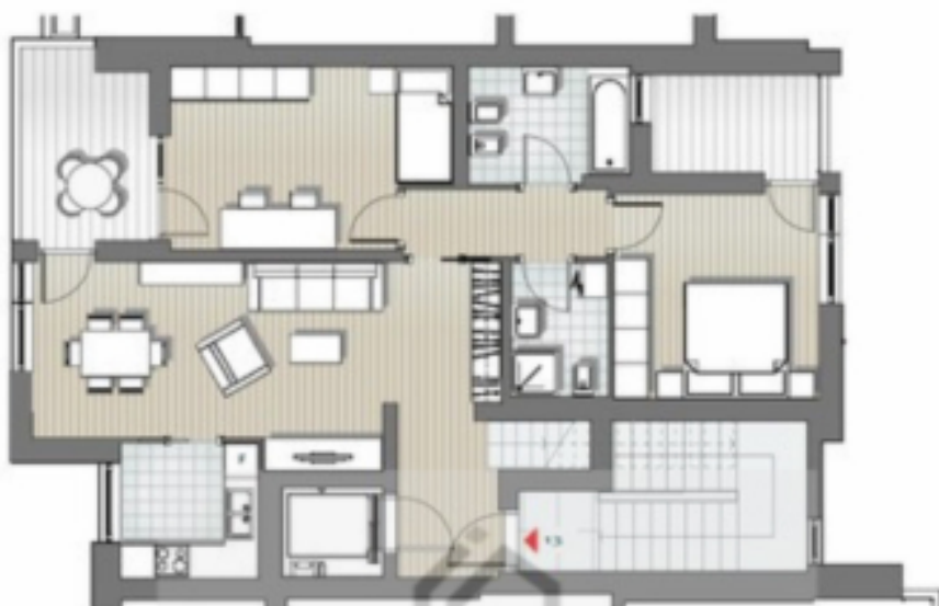
Piano sesto - scala 1:50