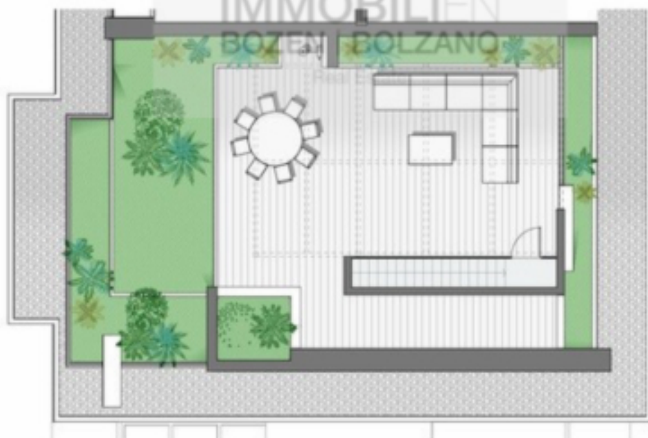
Piano settimo - scala 1:50