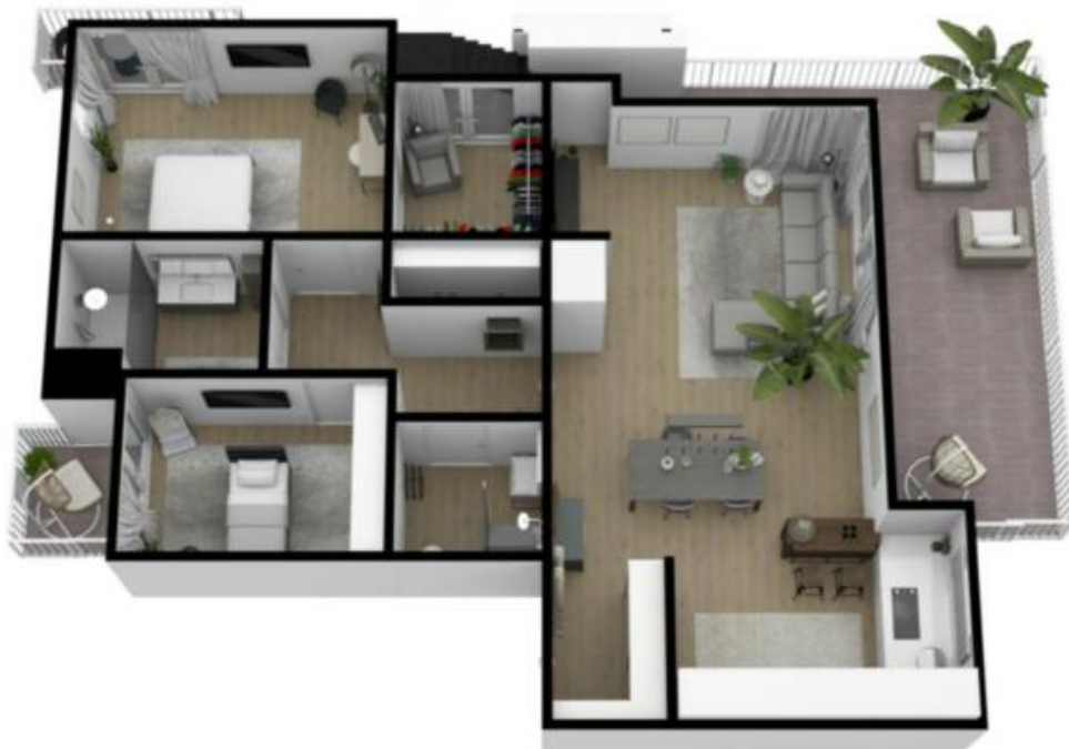
2. Obergeschoss / Piano secondo