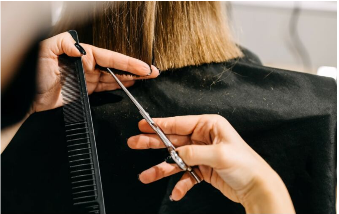
Die Bilder dienen nur zur Veranschaulichung und können abweichen. Le immagini sono solo illustrative e possono differire.